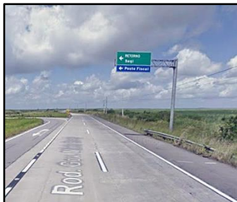
← Do norte (Natal), o retorno na BR-101

Do sul (João Pessoa): na BR-101(N), Sagi é a primeira saída depois da divisa de RN/PB (3 km além do posto fiscal).